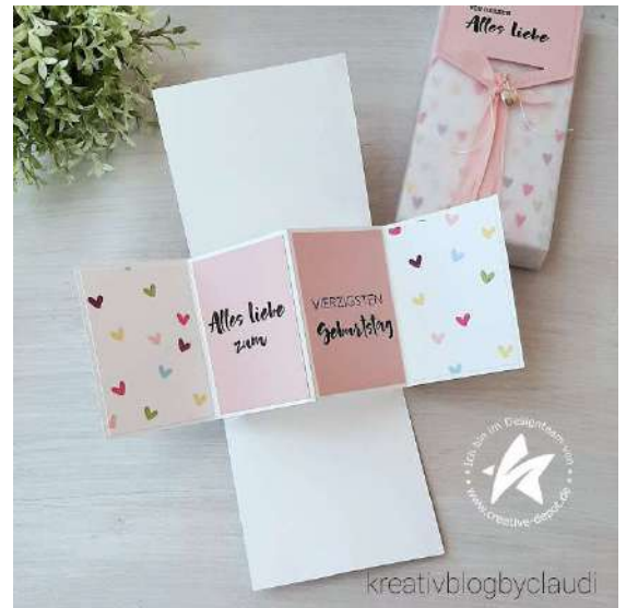
Aufklappelement 26 cm x 9 cm

Farbkarton weiß für den Klappmechanismus 20 cm x 9 cm falten bei 4,5 cm und diagonal von außen je 5,5 cm